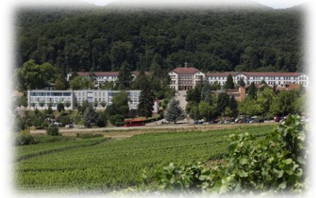
Das Pfalzkrankenhaus am Standort Klingenstein

Was unter dem Namen „Digital Signage“ bereits in anderen Bereichen und Branchen, wie der Werbung oder der Unternehmenskommunikation bekannt ist, sollte nun auch im Pfalzkrankenhaus zum Einsatz kommen. So werden die Mitarbeiter kontinuierlich mit den relevanten Informationen, direkt aus dem KIS vor Ort auf den Stationen versorgt. Gleichzeitig ist eine schnelle Aktualisierung der Daten, nahezu in Echtzeit sichergestellt, ohne dass dafür noch manuelle und zeitintensive Eingriffe erforderlich sind. Auf diese Weise wird die wertvolle Zeit der Mitarbeiter für andere, wichtigere Aufgaben frei, was letztendlich auch den Patienten unmittelbar zugutekommt.