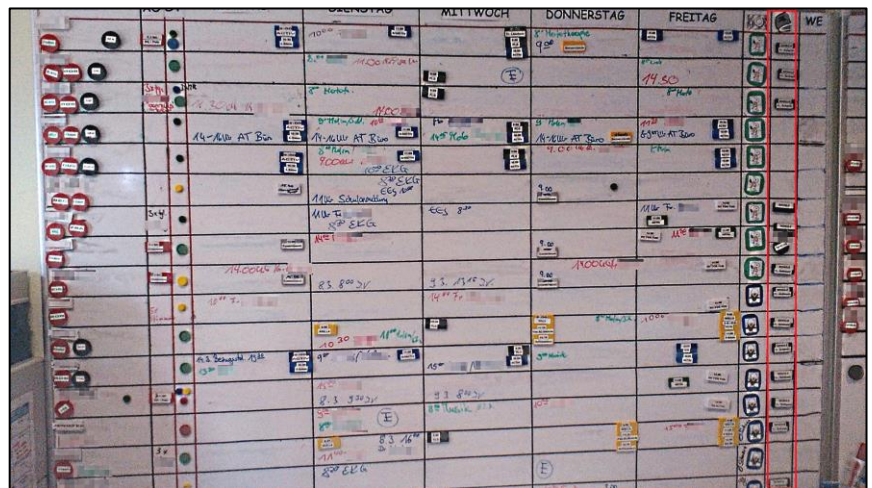
Abb.: Das ursprüngliche, manuell gepflegte Whiteboard

Im Zuge der Digitalisierung der Patientenakte werden aber immer mehr Daten im Krankenhaus-Informationssystem (kurz: KIS) eingepflegt und bereitgehalten. Parallel dazu wurden aber die Whiteboards manuell durch das Pflegepersonal laufend aktualisiert. Dies geschah immer dann, wenn Dokumentationsänderungen oder -ergänzungen im KIS eine Aktualisierung notwendig machten. Diese „doppelte Dokumentation“ hat sich als fehleranfällig erwiesen und oft dazu geführt, dass die Daten auf den Whiteboards nicht immer den aktuellsten Stand widerspiegelten. Abgesehen von diesen Nachteilen hat der manuelle Prozess darüber hinaus einen hohen Zeitaufwand für die Mitarbeiter bedeutet.